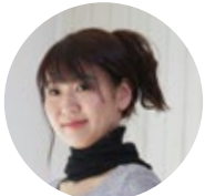
ネックウォーマーとして

さらりとした綿麻をつかった薄手のネックウォーマー。ガーゼのようにふんわり空気を含みやさしく首元を包み込みます。3色の切替カラーがアクセントになり、首元を彩ります。