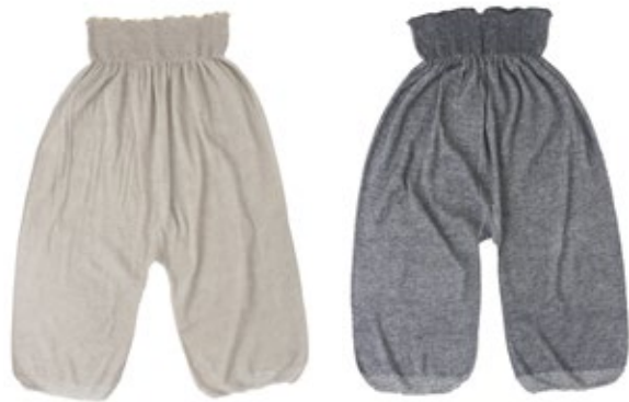
ベージュ (80) JAN : 4549503009326

ゆったりと肌にやさしくまとうのでまるで履いていないような心地よさ。ワイドパンツやスカート下の肌のベタ付きをサラッと快適に。