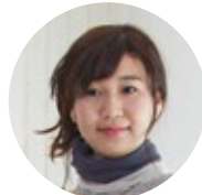
ネックウォーマーとして