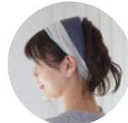
ヘアバンドとして