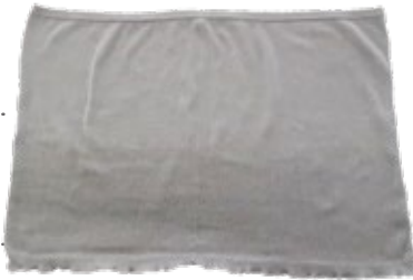
グレー (05) JAN: 4549503009302