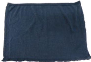
ネイビー (77) JAN: 4549503009319