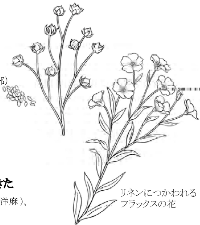
リネンにつかわれる フラックスの花

その中にリネン（亜麻）＝フラックスという植物からできた 繊維の他にもラミー（苧麻 ちよま）、ジュート（黄麻）、ケナフ（洋麻）、 ヘンプ（大麻）など植物の繊維を使用した麻は数多く存在します。